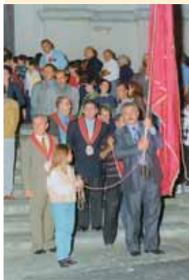
Ottobre 1994, ritorna la tradizionale processione del Rosario.