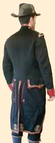
Divisa del cerimoniere.