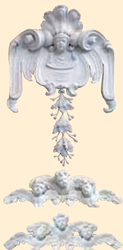
Particolari degli stucchi che decorano l'oratorio restaurati nel 2003.