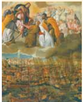
Allegoria della battaglia di Lepanto, opera di Paolo Veronese (Venezia, Galleria dell'Accademia).