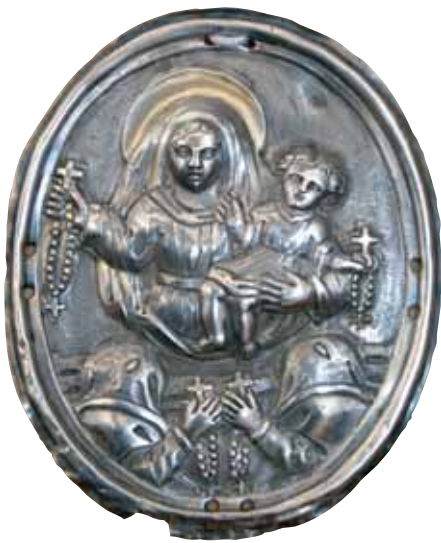
Medaglione argenteo-oro indossato dai confratelli in occasione delle processioni.

giurisprudenza. Nel 1591, a ventitré anni, richiese e ottenne di vestire l'abito dei riformati della Sanità e due anni dopo prese l'ordine sacerdotale.