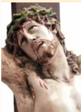
Particolare del volto di Cristo del crocifisso in gesso collocato nella sacrestia.