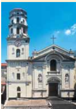
Ex cattedrale di Lettere: facciata e interno.