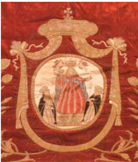
Particolare della coltre funebre con la Madonna del Rosario incoronata.

La presenza della Confraternita del SS. Rosario a Lettere nel 1586, ad appena 15 anni dalla vittoria di Lepanto, denota una certa vivacità diocesana. Non sappiamo fino a quando i confratelli si riunirono e per