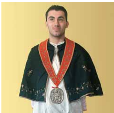
Abito del confratello con medaglione.