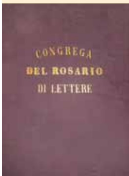
La platea della Congrega del Rosario è conservata nell'Archivio Storico Diocesano di Castellammare di Stabia.