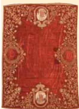
Coltre funebre per i confratelli.

servizio per i confratelli. Le rendite di alcuni fondi agricoli e di proprietà immobiliari e di lasciti testamentari hanno consentito di sostenere le spese per le sepolture dei confratelli, di manutenzione della Cappella annessa all'ex Cattedrale di Lettere, per le processioni e per altre esigenze. A tal fine fu costruita nel 1952 una cappella gentilizia con loculi per la conservazione dei resti mortali dei confratelli.