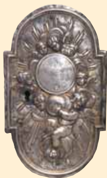
Porticina argentea del tabernacolo.

CAP. 7.° - Che li detti Fratelli sieno tenuti, ogni volta che more un Fratello accompagnarlo alla sepoltura vestito colla veste della Confraternita, e recitarli il Rosario di quindici poste, e chi sa leggere l'intiero Officio dei Morti. E similmente ognuno di essi Fratelli debba intervenire colla veste suddetta nelle Processioni, che si faranno da detta Confraternita, e mancando ciascuno, di essi debba ancora ricevere la mortificazione, che li sarà imposta dal suddetto Priore.