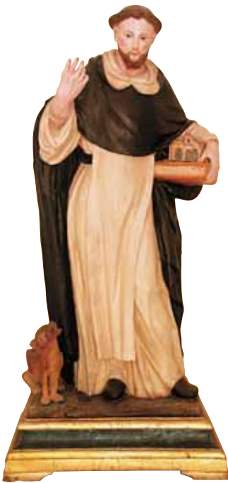
Statua lignea di San Domenico collocata nella nicchia ricavata durante i lavori di restauro del 2003 sulla prima rampa di accesso alla congrega.

impostori che a fini di lucro avevano fondato congreghe del Rosario in varie cittadine, le autorizzazioni vennero date quasi sempre a predicatori e le confraternite nacquero anche separatamente dai conventi domenicani, a seguito dell'intensa diffusione della pratica del Santo Rosario.