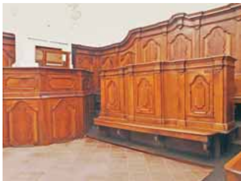
Coro ligneo: il banco del Priore, restaurato negli anni 2002-2003.