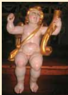
Puttino ligneo restaurato nel 1998 utilizzato in occasione della processione della Madonna e montato in coppia alla base della statua.