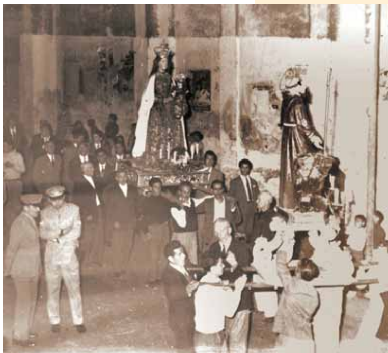
Processione degli anni '50.

Ma anche la funzione sociale emerge dai documenti d'archivio. Basti citare a tal proposito i riflessi