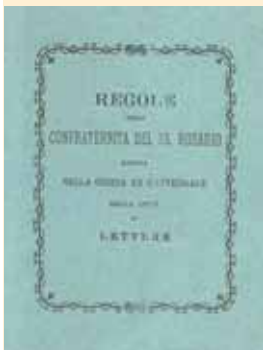
Copertina delle regole della Confraternita, Tipografia Stabiana 1882.

CAP. 2° . - Terminata che sarà l'elezione suddetta si debbia ancora procedere all'elezione del Mastro, e Cassiero di detta Confraternita laico anco con voti segreti, il quale deve avere la cura di esigere tutte