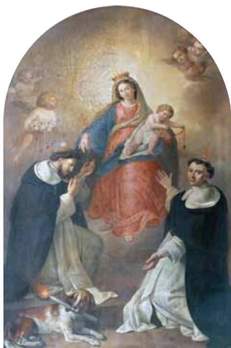
La Madonna del Rosario tra i Santi Domenico e Vincenzo, dipinto del sec. XVIII posto sull'altare del transetto sinistro della Parrocchia di Santa Maria Assunta e San Giovanni Battista.

Nella piccola comunità contadina di Lettere la congrega svolse sempre un ruolo di sostegno e di