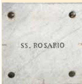
Lastra marmorea posta alla sinistra della porta d'ingresso alla Congrega nella ex cattedrale.