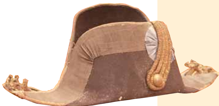
Cappello del Cerimoniere (sec. XIX).