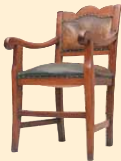
Sedia del Priore restaurata nell'anno 2003 dalla ditta Scavella-D'Alessandro.