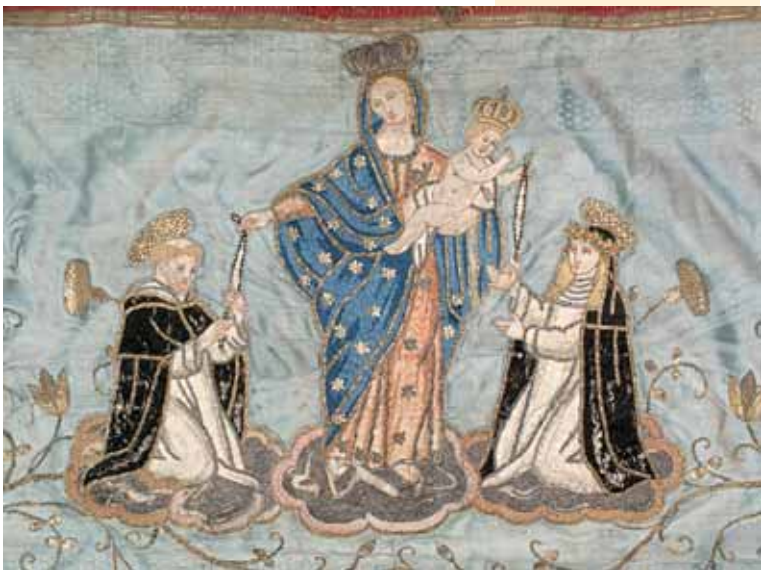
La Vergine del Rosario tra San Domenico e Santa Caterina, particolare del pallio ricamato (sec. XIX).

Allo stesso tempo la confraternita appare sempre più come un'organizzazione laica in grado di risolvere ai propri aderenti il problema della sepoltura e dei suffragi e, in definitiva, della morte.