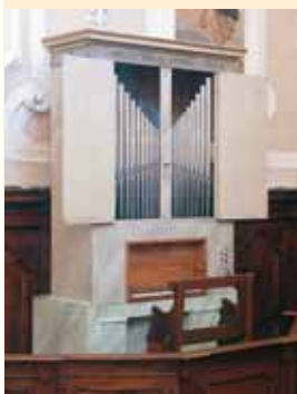
L'organo ottocentesco dell'oratorio dopo il restauro dell'anno 2004.